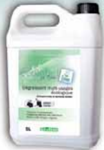
Dégraissant multi-usages écologique

Une gamme complète pour répondre à vos besoins