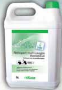
Nettoyant multi-usages écologique