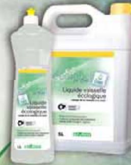
Liquide vaisselle écologique