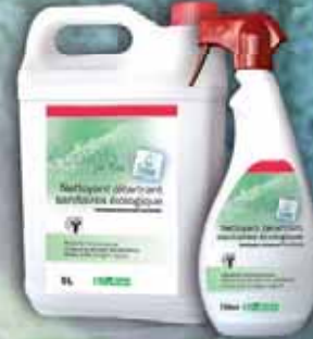
Nettoyant détartrant sanitaires écologique