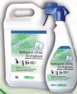
Nettoyant vitrres écologique